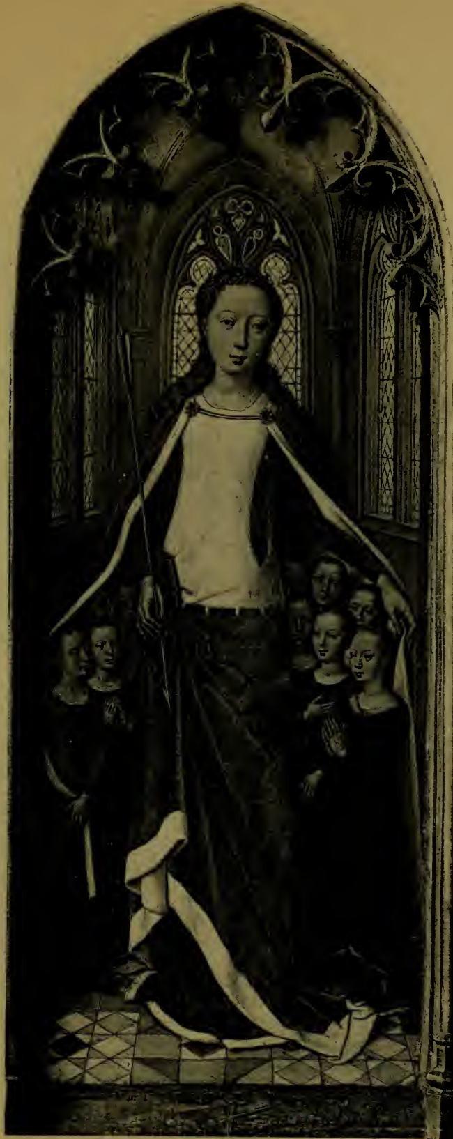
Sainte Ursule protégeant les Vierges, extrémité de la Châsse de Ste-Ursule.